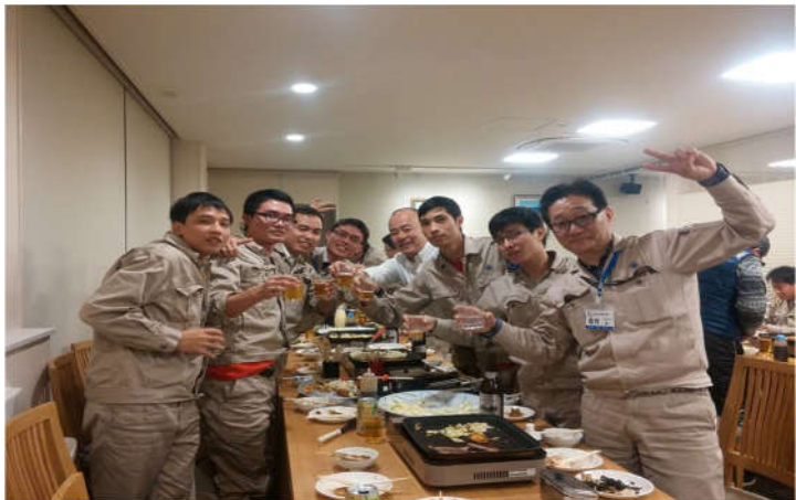
02 SV lớp KTTT K55 công tác tại Cty Daizo Tec Oshima (Nhật Bản), 2016