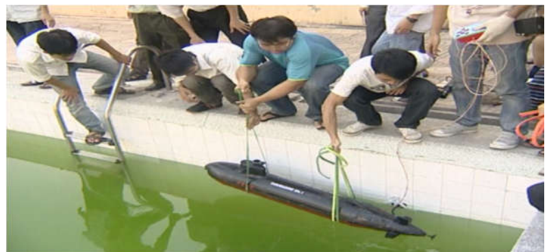
Sinh viên nghiên cứu khoa học, thiết kế tàu ngầm/ phương tiện lặn