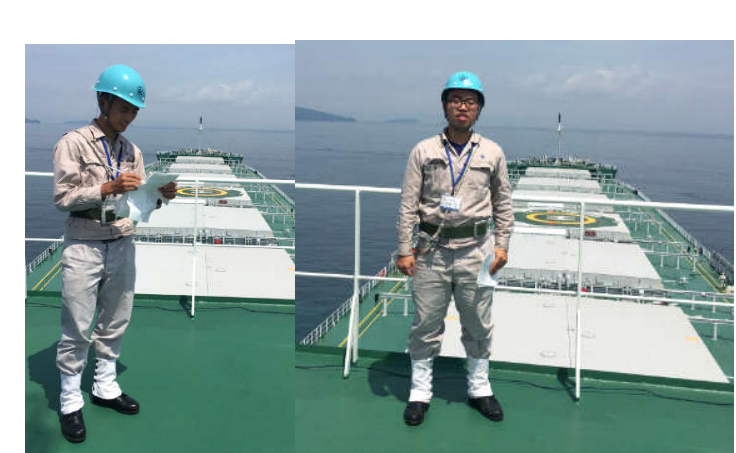
02 SV lớp KTTT K58 thực tập tại CTĐT Oshima (Nhật Bản), tháng 7/2017