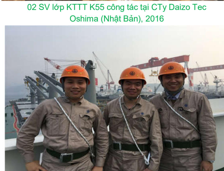
03 SV lớp KTTT K56 công tác tại Cty Daizo Tec Oshima (Nhật Bản), 2017