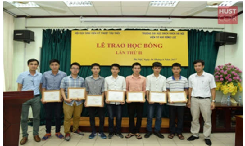
Viện trưởng Viện CKDL cùng Hội trưởng Hội Cựu SV trao học bổng cho SV ngành K58, K59, K60 (16/06/2017)