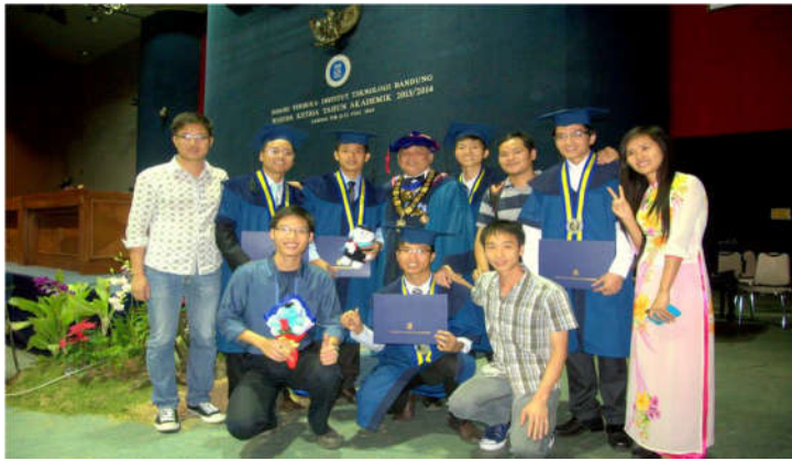
4SV lớp KTTT K52 tốt nghiệp thạc sỹ tại Bandung, năm 2014