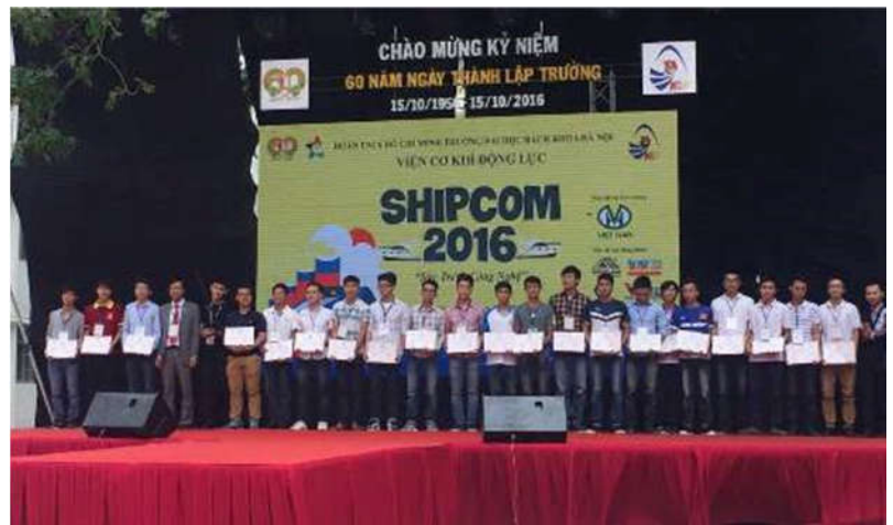
Viện trưởng Viện CKDL cùng Hội Cựu SV ngành KTTT trao GCN cho nhóm SV dự thi Shipcom (14/10/2016)