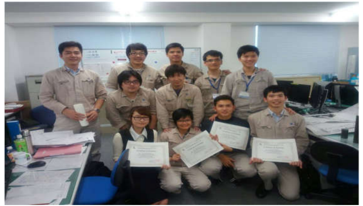
01 SV lớp KTTT K54 thực tập tại CTĐT Oshima (Nhật Bản), tháng 7/2013